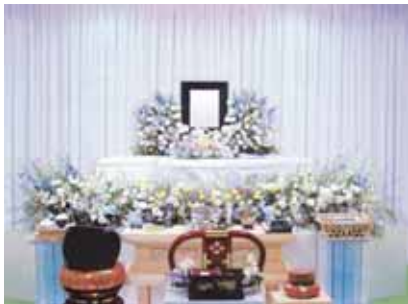
セット+7万円にて上記 花祭壇に変更できます ご供花 2 基はセット含みます