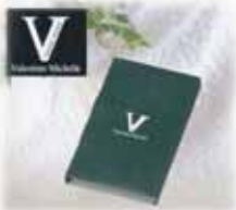
返礼品 (祖供養品) ハンドタオル@100 付き