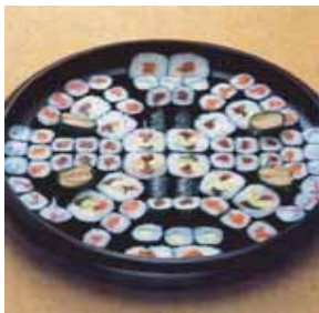
巻寿司 5 人盛@14

菩提寺が無い又は遠方で来られない等の場合は担当者へお申し付け下さいご紹介いたします。(1日5万円よりご紹介できます。)