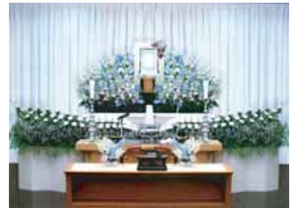
セット+18万円にて上記 花祭壇に変更できます ご供花 2 基はセット含みます