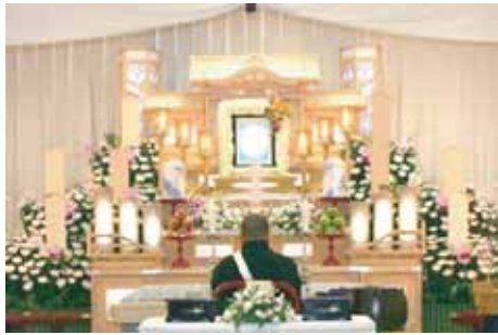
白木五段祭壇 祭壇脇生花 2 基を含む