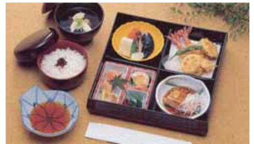
精進落とし会席ご膳鈴蘭@20