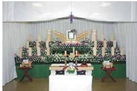
セット+9万円にて上記 花祭壇に変更できます 写真祭壇脇ご供花は一对 (2 基) セットに含みます