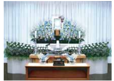
セット+18万円にて上記花祭壇に変更できます ご供花2基はセット含みます