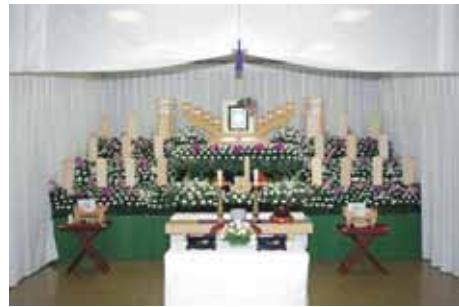
セット+9万円にて上記花祭壇に変更できます 写真祭壇脇ご供花は一對(2基)セットに含みます