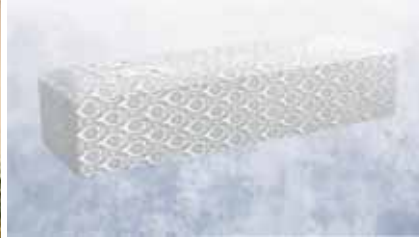
白布張り高級棺 (6尺) (6.25尺へ変更は +3,000円)

菩提寺が無い又は遠方で来られない等の場合は担当者へお申し付け下さいご紹介いたします。(1日5万円よりご紹介できます。)