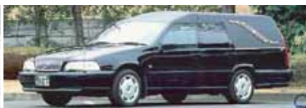
出棺の車両をご希望の場合はお申し付け下さい