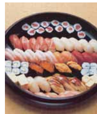
セット+31,500円にて巻寿司を上握寿司変更できます