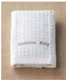
返礼品(祖供養品) ハンドタオル@30付き (525円 品種変更可)

配膳人通夜1人告別式1人御飲物15,000円分を含む ※15,000円を超えた場合は超過分のご請求となります。