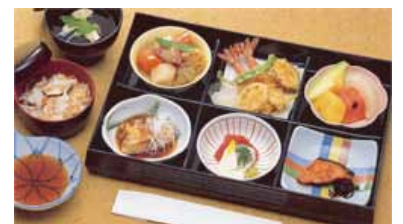
セット+22,000円にて セット鈴蘭@20より上記 写真あけびに変更できます