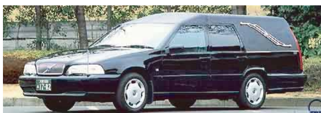
出棺の車両をご希望の場合は お申し付け下さい