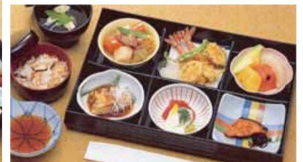
セット鈴蘭@20より上記 写真あけびに変更できます (単価3,570円)