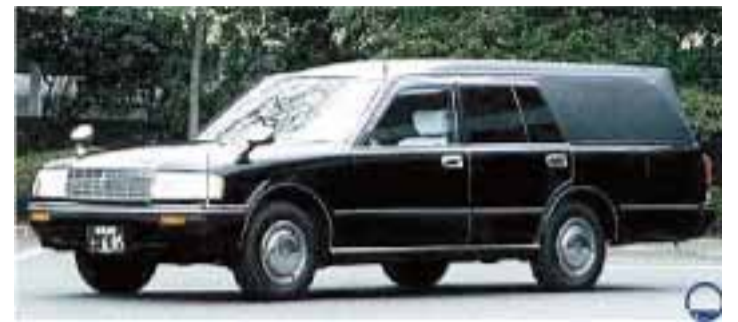
別館式場から火葬棟へ