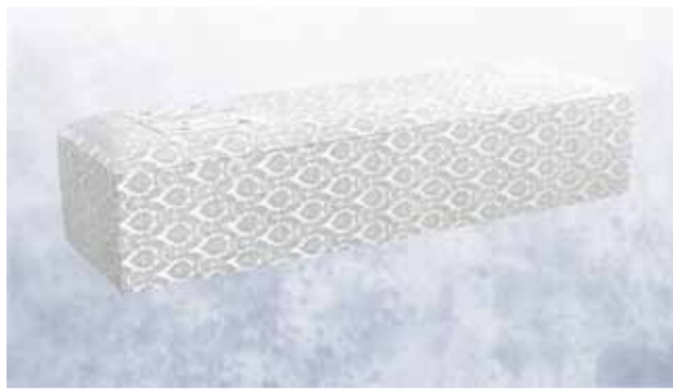
白布張り高級棺 (6尺) (6.25尺へ変更は +3,150円)