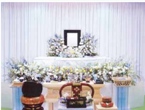
花祭壇に変更できます ご供花2基はセット含みます