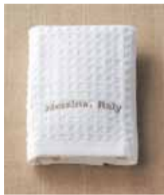
返礼品 (祖供養品) ハンドタオル@30付き (525円 品種変更可)

配膳人通夜1人告別式1人御飲物15,000円分を含む ※15,000円を超えた場合は超過分のご請求となります。