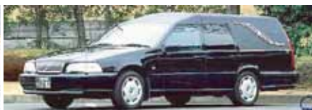
出棺の車両をご希望の場合は お申し付け下さい