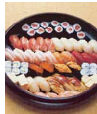
セット +31,500円 にて巻寿司を上握 寿司変更できます