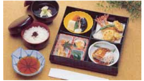
精進落し会席ご膳【鈴蘭】@20