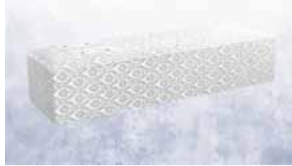
白布張り高級棺 (6尺) (6.25尺へ変更は +3,000円)

菩提寺が無い又は遠方で来られない等の場合は担当者へお申し付け下さいご紹介いたします。(1日5万円よりご紹介できます。)