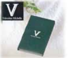
返礼品 (祖供養品) ハンドタオル@50 付き