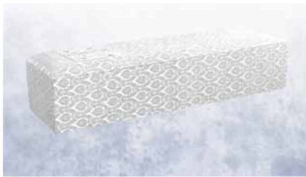
白布張り高級棺 (6尺) (6.25尺へ変更は +3,150円)

菩提寺が無い又は遠方で来られない等の場合は担当者へお申し付け下さいご紹介いたします。(1日5万円よりご紹介できます。)