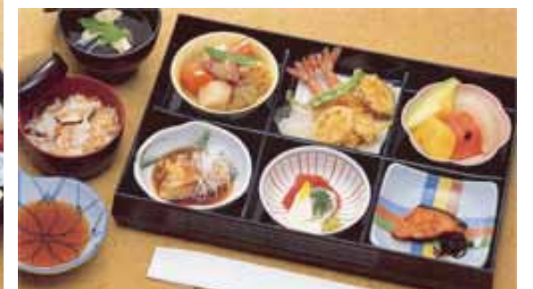
セット鈴蘭@20より上記 写真あけびに変更できます (単価3,570円)