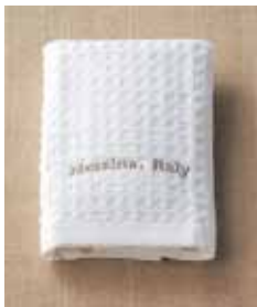
返礼品(祖供養品) ハンドタオル@30付き (525円 品種変更可)

配膳人通夜1人告別式1人御飲物15,000円分を含む ※15,000円を超えた場合は超過分のご請求となります。