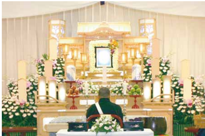
白木五段祭壇 祭壇脇生花2基を含む