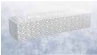
白布張り高級棺 (6.25 尺)