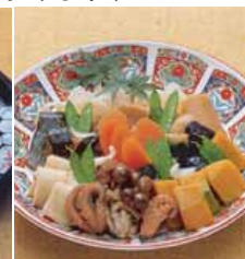
煮物盛合せ 11 台