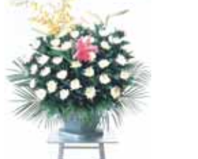
生花 (喪主花 2 基)