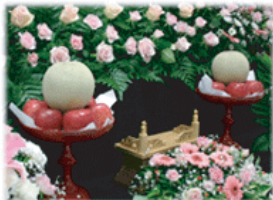
盛り物 (供物) 一対