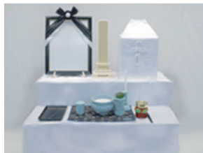
後飾り (中陰飾り) 一式