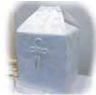
収骨容器一式 (桐箱・覆い等)