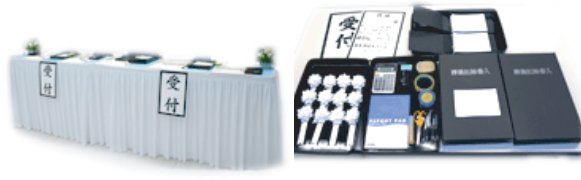
受付・会計設備一式