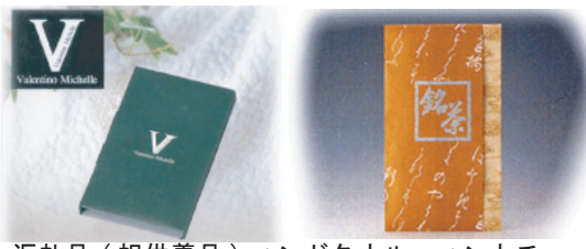
返礼品 (祖供養品) ハンドタオル、ハンカチ お茶 (即返し品等、多数取り揃えております)