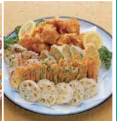
野菜天婦羅と鳥唐揚 11 台