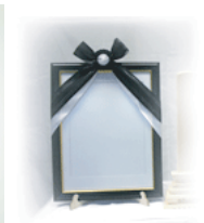
お別れ用 (お持帰り用) 遺影写真 (四つ切サイズ)