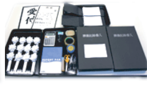
受付・会計設備備品