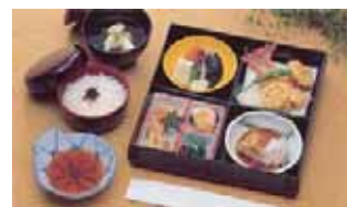
精進落とし会席ご膳【鈴蘭】@20