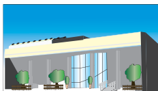
式場と休憩室 (通夜) 使用料