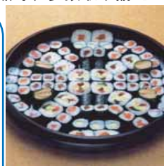
巻き寿司 22 台