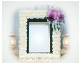
遺影写真 (光額付) と花装飾額