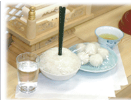
御飯と団子 (必要に応じて)