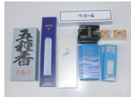
線香・香・蠟燭・炭等、小物・消耗品