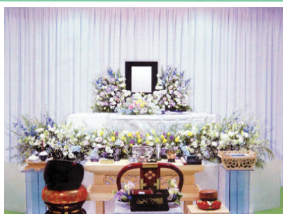
セット +73,500円にて上記 花祭壇に変更できます ご供花2基はセット含みます