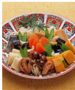
煮物盛り合せ 3人盛@7