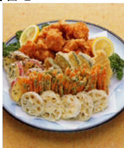
野菜天・鳥唐揚 3人盛@7