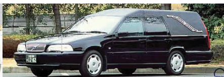
出棺の車両をご希望の場合は お申し付け下さい※別途となります