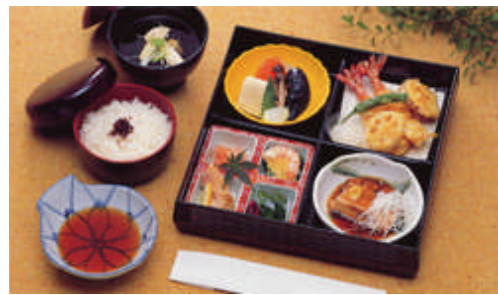
精進落し会席ご膳【鈴蘭】@20