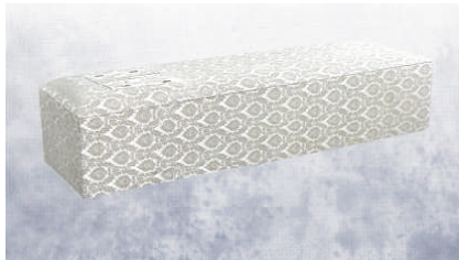
白布張り高級棺 (6尺) (6.25尺へ変更は +3,150円)

菩提寺が無い又は遠方で来られない等の場合は担当者へお申し付け下さいご紹介いたします。(1日5万円よりご紹介できます。)