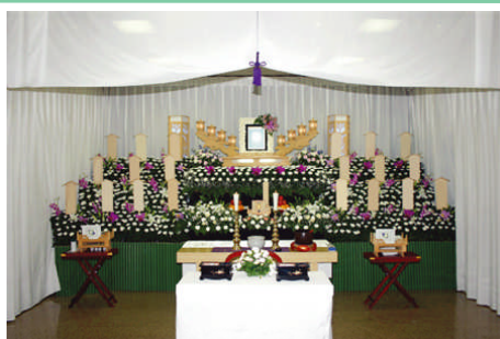
セット +94,500円にて上記 花祭壇に変更できます 写真祭壇脇ご供花は一对 (2基) セットに含みます