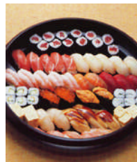
セット +23,814円 にて巻寿司9台を 上握寿司9台へ 変更できます