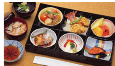
セット +24,240円にて セット<鈴蘭>@20より上記 写真<あけび>に変更できます