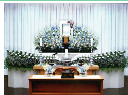
セット +189,000円にて上記 花祭壇に変更できます ご供花2基はセット含みます