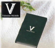
返礼品 (祖供養品) ハンドタオル@30 付き